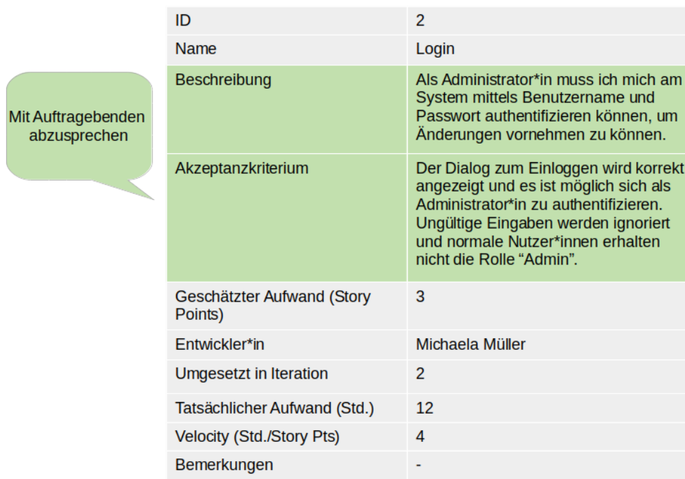
Abbildung 2: Beispiel einer formalisierten User Story.

User Stories sind Arbeitspakete, die innerhalb einer Iteration von dem Team bearbeitet werden. User Stories werden durch die Studierenden formalisiert, ein Beispiel einer solchen User Story findet sich in Abbildung 2.